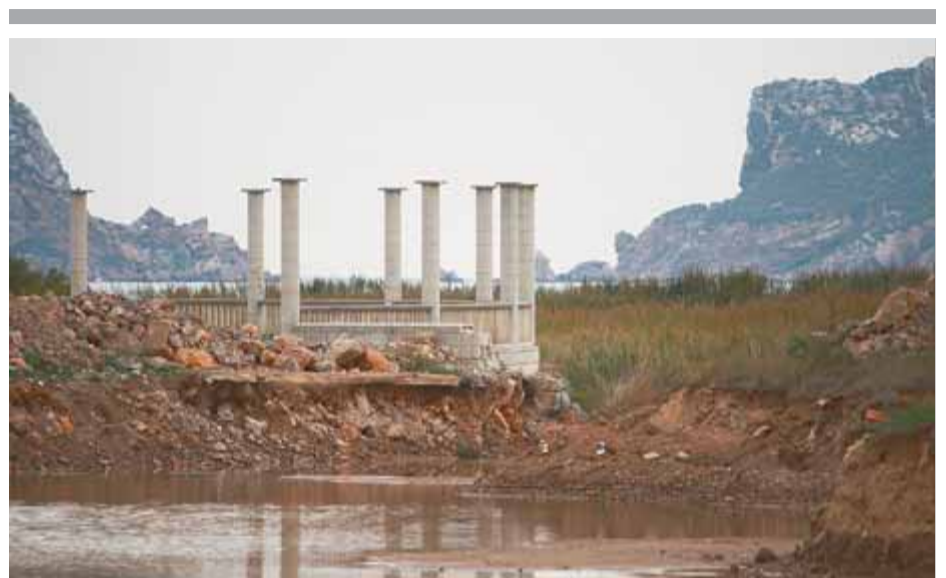
La zona de la llacuna ha quedat plena d'aigua de la darrera llevantada