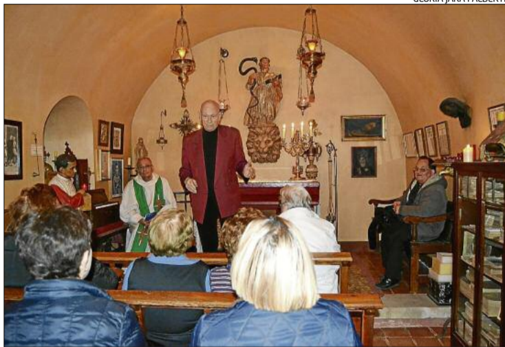
Un moment de la missa que va tenir lloc a la capella del Gran Museu