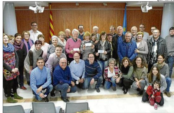
Acte de lliurament, amb les entitats de discapacitats receptors al centre (mostrant els xecs), i membres de l'Ajuntament i entitats.