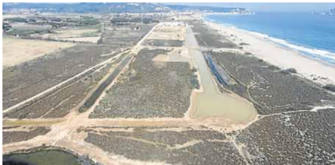
Vista aèria de la Pletera amb les zones de llacunes, a la dreta

L'actuació ja dona forma al territori amb la retirada de tots els elements que formaven el passeig marítim i els carrers adjacents de l'antiga urbanització. També s'ha retirat bona part de la runa amb què es van omplir les llacunes per adequar-hi les parcel·les